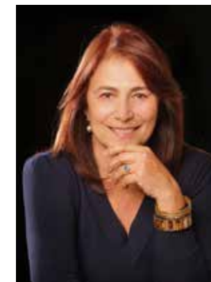
Esperanza Silva Presidenta de Chileactores

En este camino hemos aprendido que la creación debe protegerse y que el amor por este oficio nos hace indestructibles. Así, continuaremos defendiendo con compromiso y respeto los derechos de los miembros de Chileactores y de los 90.000 artistas de las entidades internacionales que representamos.