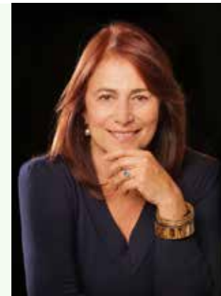
Esperanza Silva Presidenta