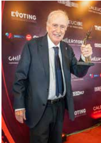
Mejor Actor Protagonico Jaime Vadell Pinochet "El Conde"