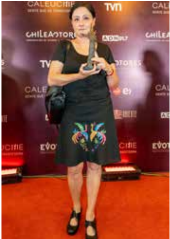
Mejor Actriz Protagonica Catalina Saavedra Señora Vero "Rotting in the Sun"