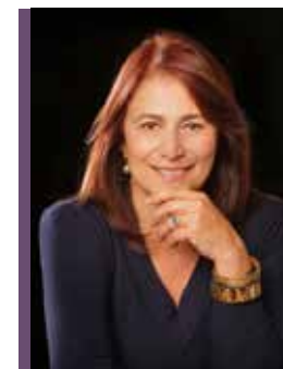
Esperanza Silva Presidenta