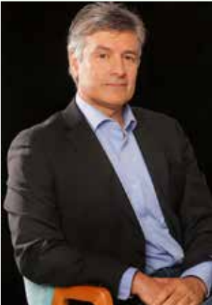
Rodrigo Águila Director General de Chileactores

Sigue siendo importante la defensa continua de los derechos que representamos ya que aún existen usuarios de interpretaciones protegidas que se niegan a reconocerlos. Este año comenzamos el cobro judicial en contra de importantes empresas de comunicaciones y de entretenimiento, esperamos que los resultados sean positivos en el menor plazo posible.