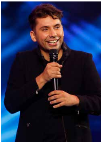
Mejor Comediante Fabrizio Copano Festival Internacional de la Canción de Viña del Mar TVN / CANAL 13