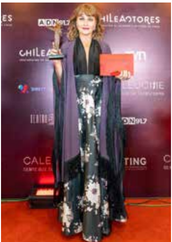
Mejor Actriz Protagonica Amaya Forch Cecilia "Cecilia, La Incomparable" TVN